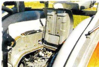
◎開放式座椅，油壓控制閥及感知器等之檢點快速方便。