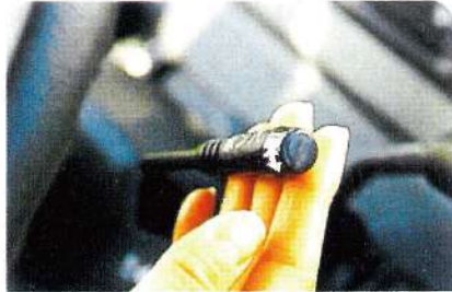
◎只需輕觸控制桿，耕犁部既能正確、迅速的自動升降。