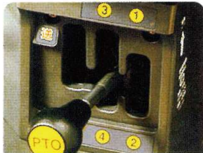
◎四段變速及逆轉PTO田埂邊積土之整平可很輕鬆地完成。