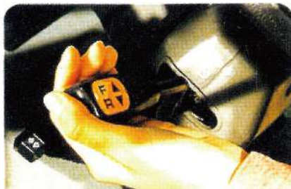
◎免踩離合器既可前後進切換之U型換動變速，提昇作業效率。