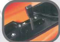
剪草盤油壓舉升桿