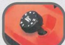
簡易的剪草高度調整鈕