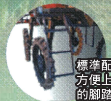
標準配備 方便上下車 的腳踏板