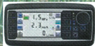
可手動直接操作的 觸控面板式 新型速度連動散佈裝置